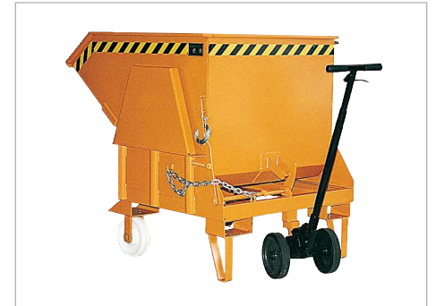
Typ BK mit Aufnahme für Hebelroller Typ B2