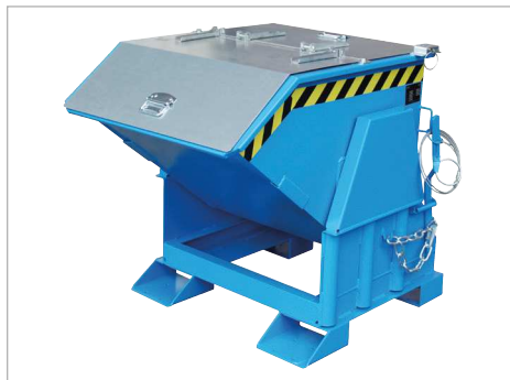
Typ BK mit Deckel