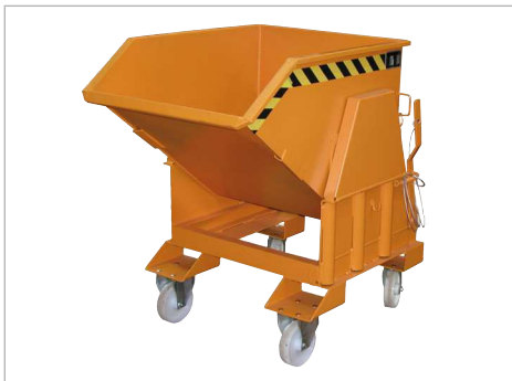
Typ BK mit Rollen