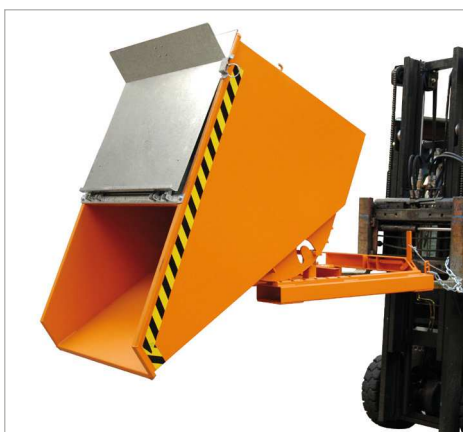
Typ EXPO mit Deckel