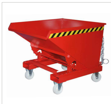
Typ EXPO mit Rollen