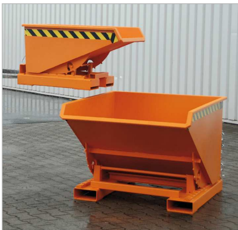
Typ EXPO 150 und Typ EXPO 600